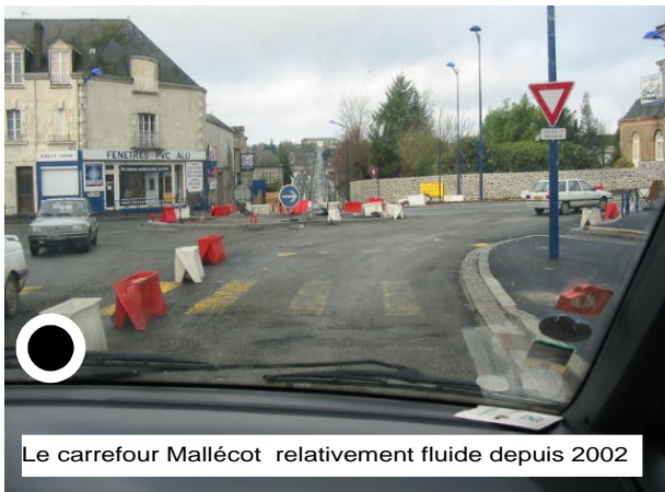
Le carrefour Mallécot relativement fluide depuis 2002

Si c'est plus fluide à Mallécot, ça bouchonne de plus en plus, d'Est en Ouest, sur la RN 12, rue A. De Loré notamment et Bd de l'Europe (viaduc).